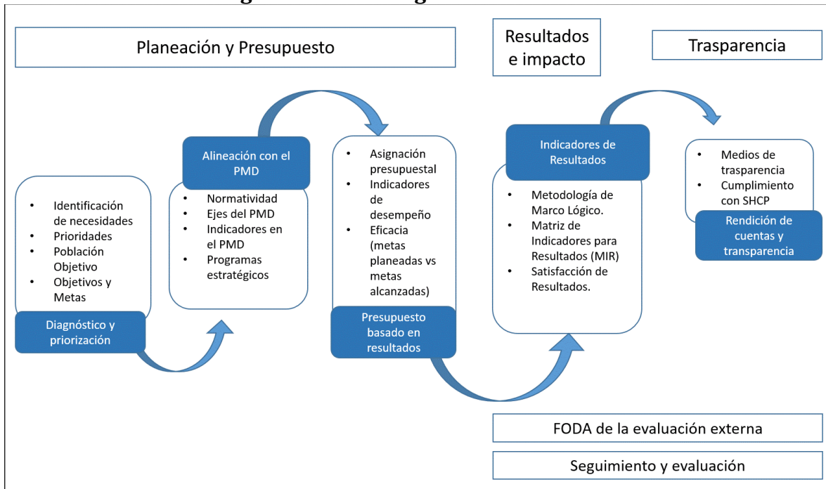
Figura 1. Metodología de la evaluación